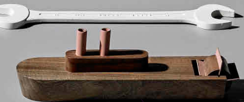
BARCO DE VAPOR Piróscrafo en madera de nogal y metal. 75,02 euros.